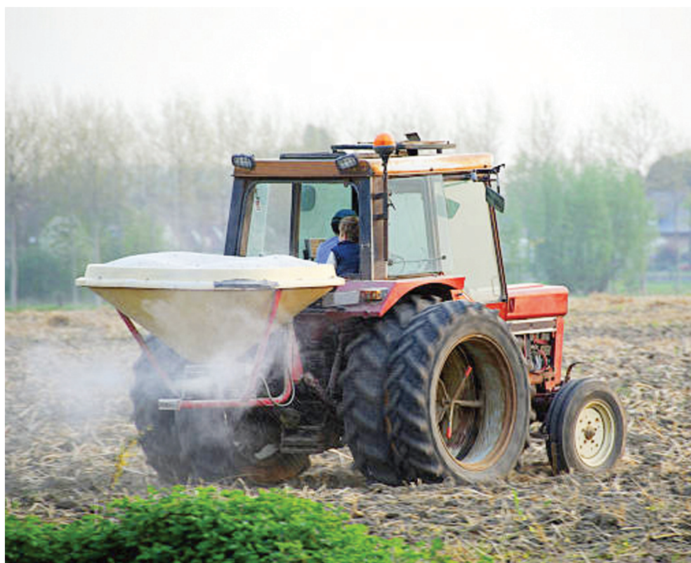
Rozsiewanie nawozu wapniowego

Wyniki analiz prowadzonych od lat wskazują na potrzebę weryfikacji aktualnych zaleceń w celu bardziej precyzyjnego dopasowania dawek wapna do parametrów gleby wymagającej odkwaszenia.